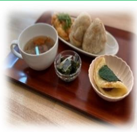
「みずき」 芋餅の柏餅