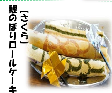
「さくら」 鯉のほりロールケーキ

5月5日は端午の節句でした。各事業所で催しが行われ、厨房からオリジナルスイーツが提供されましたのでご紹介いたします。行事を企画した職員から依頼を受け、調理師さん達が案を練って考案したオリジナルになります。利用者や職員にも見た目や味に賞賛が集まっています。「見ても楽しい言葉がありました。」と調理師さんからも心強い言葉がありました。